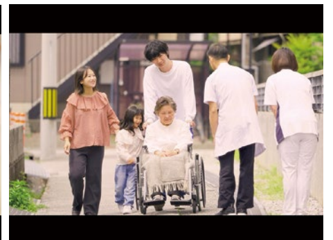
患者さん家族と職員の交流