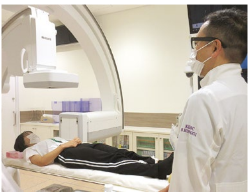
ほそぎハートセンターカテ室見学

すごく楽しかった」「憧れの手術室に入れてうれしかった」「手術で着用する服を着せてくれた」と子どもたちは貴重な体験に大喜びです。