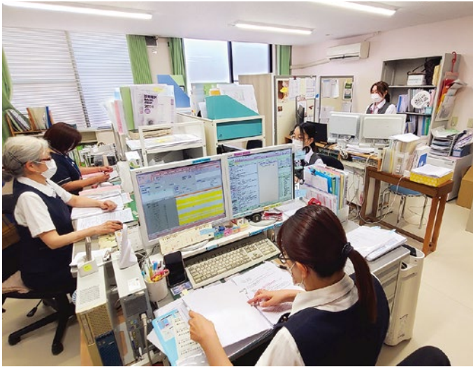
コミュニケーションがとりやすい診療情報課室

当院はDPC制度（急性期入院医療を対象とした診療報酬の包括評価制度）に参加していることから、診療情報課の仕事内容は多岐にわたります。主な業務内容を以下にまとめました。