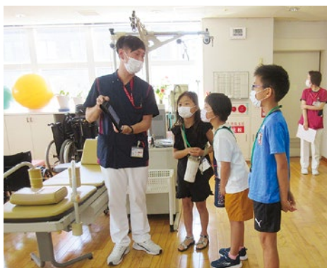
リハビリテーション課見学

医師や看護師、薬剤やリハビリなどの職員の子どもたち、小学3年生から高校3年生まで6名が参加しました。子どもたちは、朝集合してすぐに大スクリーンで院内Web朝礼「ほそぎ10分ミーティング」へ参加しました。職員全体のWeb朝礼体験に、思わず「クスッ」と笑ってしまったそうです。