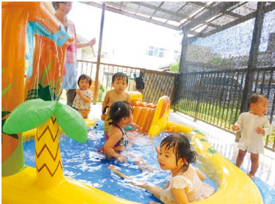
思い思いの楽しみ方で プールを満喫する子どもたち

当施設では、7、8月の晴れた日の午前限定で、プールがオープンします。今年は、滑り台、滝のトンネル、