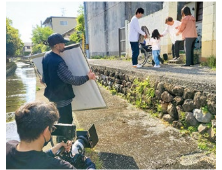
地域にも出て、撮影を敢行

撮影当日は、限られた時間内で、独特の緊張感の中、各シーンの撮影が行われました。カメラを向けられることに慣れていない職員や子役らが大健闘し、ディレクターの演技指示のもと、自然な演技を披露しました。