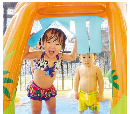
「いないいない、ばー！」