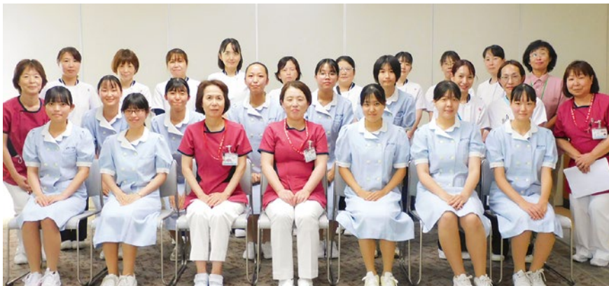
ふれあい看護体験参加者と職員

このふれあい看護体験での感想を参加者に記入してもらおうと、「患者さんとのコミュニケーションの取り方や難しさも実感できました」「患者さんと看護師さんの関わりをみてますます看護師になりたいという気持ちになりました」「進路を決める際にこの経験がすごく役立つと実感しました」「みんなやさしくて、挨拶もしてくれ素晴らしい看護師さんたちだなあと思いました」などの意見がありました。この体験を通して患者さんに寄り添い、思いやりのある看護師になり、看護師という仕事に誇りを持つきっかけになるとうれしく思います。