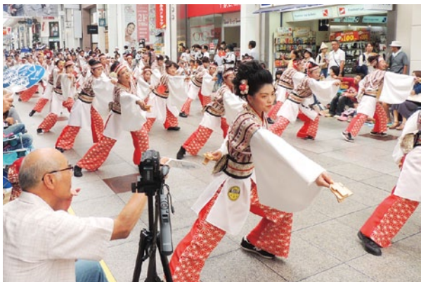
帯屋町商店街を演舞 (2017年)