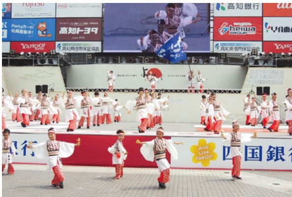
中央公園競演場にて (2017年)