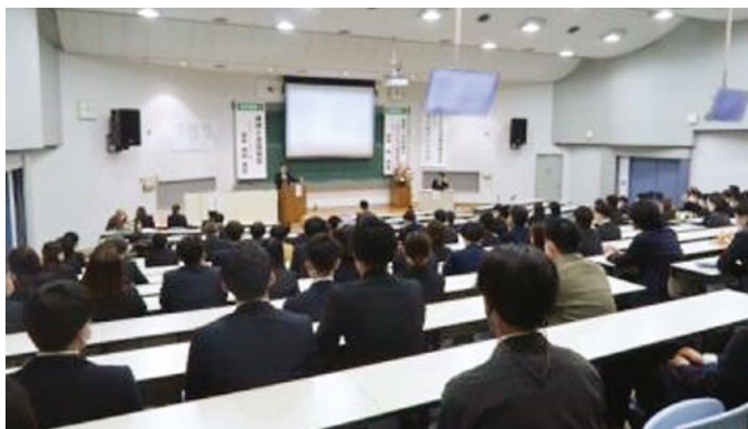
高知県理学療法学会の様子

今回、生活環境支援系のセクションにおいて、「 健康教室への参加が健康意識や行動変容に与える影響 」との