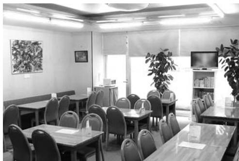
細木病院 レストラン（新館地下）