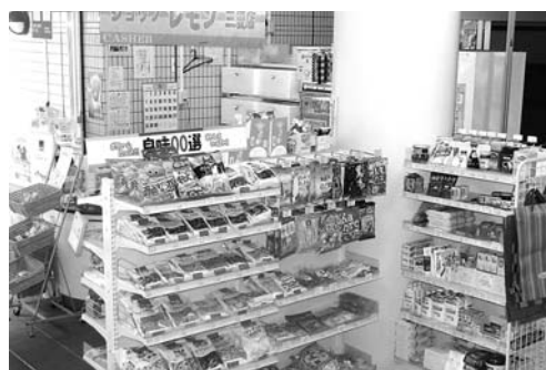
三愛病院 売店「レモン 三愛店」