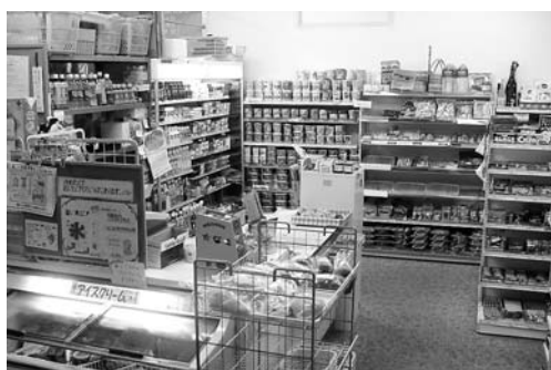
細木病院 売店「レモン」